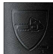
Schnittschutz Klasse 2