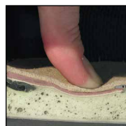
HAIX® MSL System